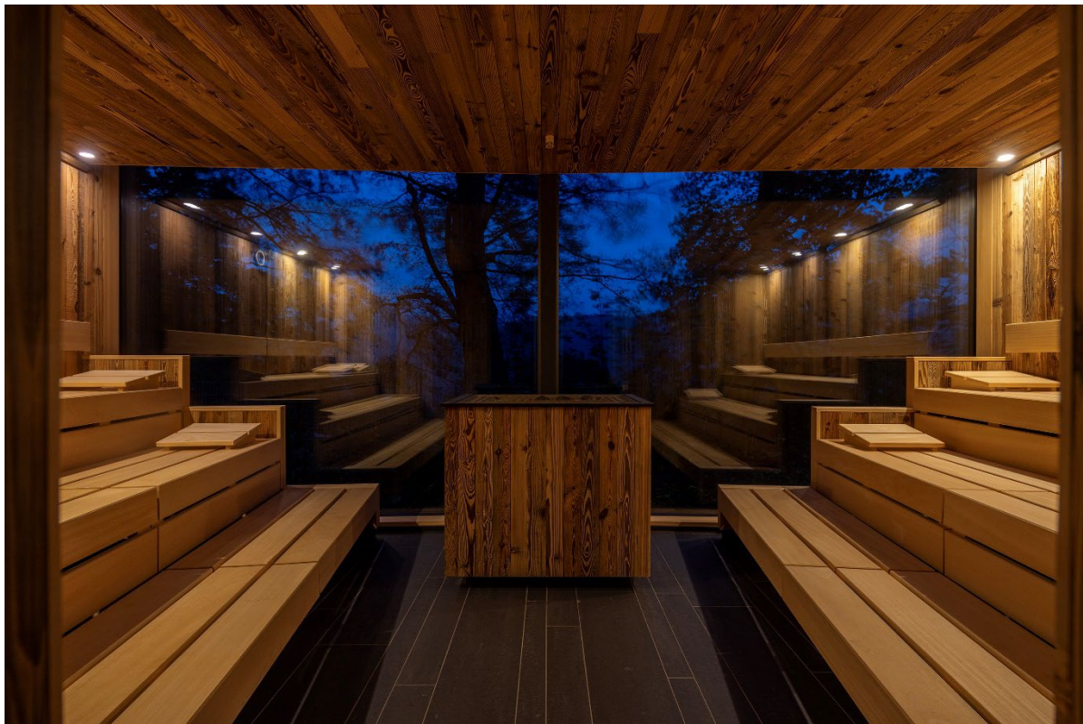
Luisenhöhe Gesundheitsresort Schwarzwald

Wenn der Schnee die Landschaften in eine glitzernde weiße Decke hüllt und die Temperaturen frostig sind, bieten erstklassige Wellnesshotels und elegante Resorts ideale Ziele für eine außergewöhnliche Winterauszeit. Die kalte Jahreszeit verwandelt sich hier in ein stimmungsvolles Erlebnis, das Körper und Seele mit Wärme und tiefer Entspannung erfüllt. Insbesondere die Spas laden mit individuell konzipierten Wellnessbereichen von KLAFS – Weltmarktführer für Sauna, Wellness und Spa – auf eine sinnliche Reise aus Wärme, Wohlbefinden und Tiefenentspannung ein.