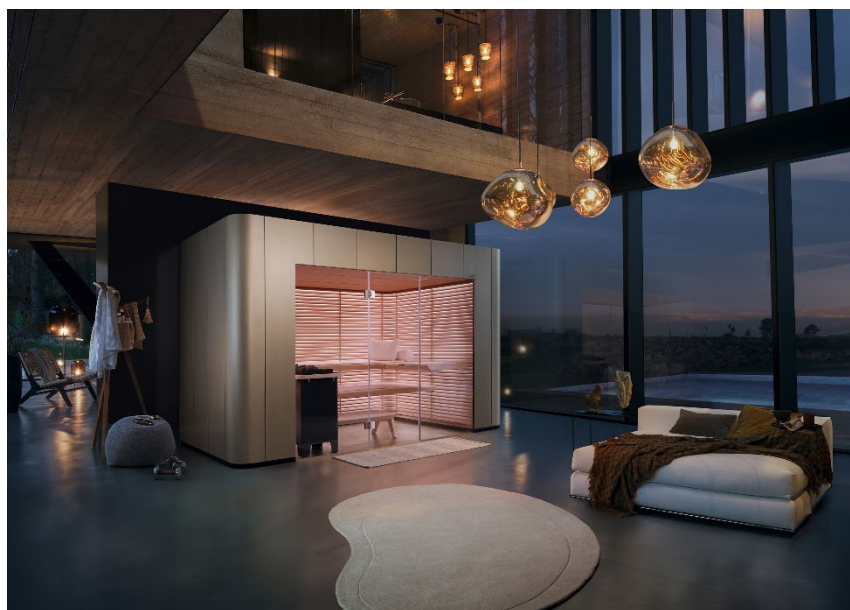
Die Sauna als Designobjekt: die Sauna S11. Design by Studio F. A. Porsche.

Individueller, multisensorischer, smarter und noch nachhaltiger: Die Wellnessrends 2025 prägen nicht nur die Zukunft der Sauna- und Spabranche, sondern verbessern auch das allgemeine Wohlbefinden im Alltag zunehmend – mit exklusiven, hochwirksamen Wellnesslösungen, die Körper und Geist durch ganzheitliche Erlebnisse stärken.