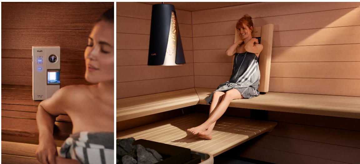
Zusätzliche Anwendungen wie die Salzhinhalation mit dem Microsalt SaltProX und Infrarot-Tiefenwärme mit dem InfraPLUS-Sitz erweitern die individuellen Möglichkeiten zur aktiven Gesundheitsvorsorge in der Sauna.