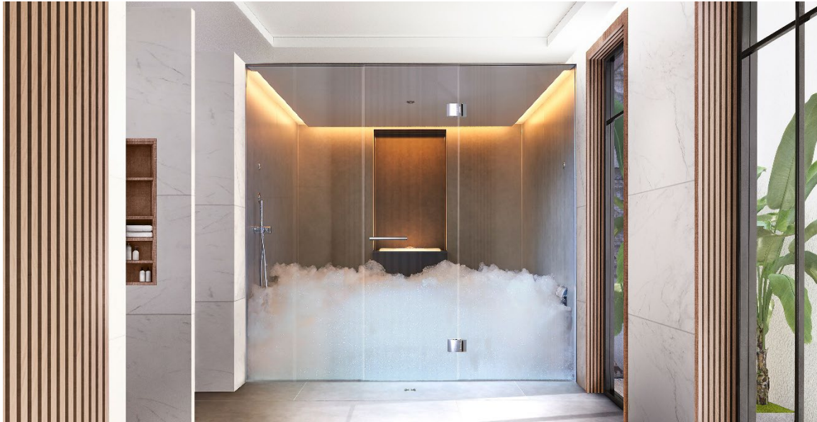
Das Schaumdampfbad ESPURO® bietet eine neue sinnliche Erfahrung mit pflegendem Schaum.