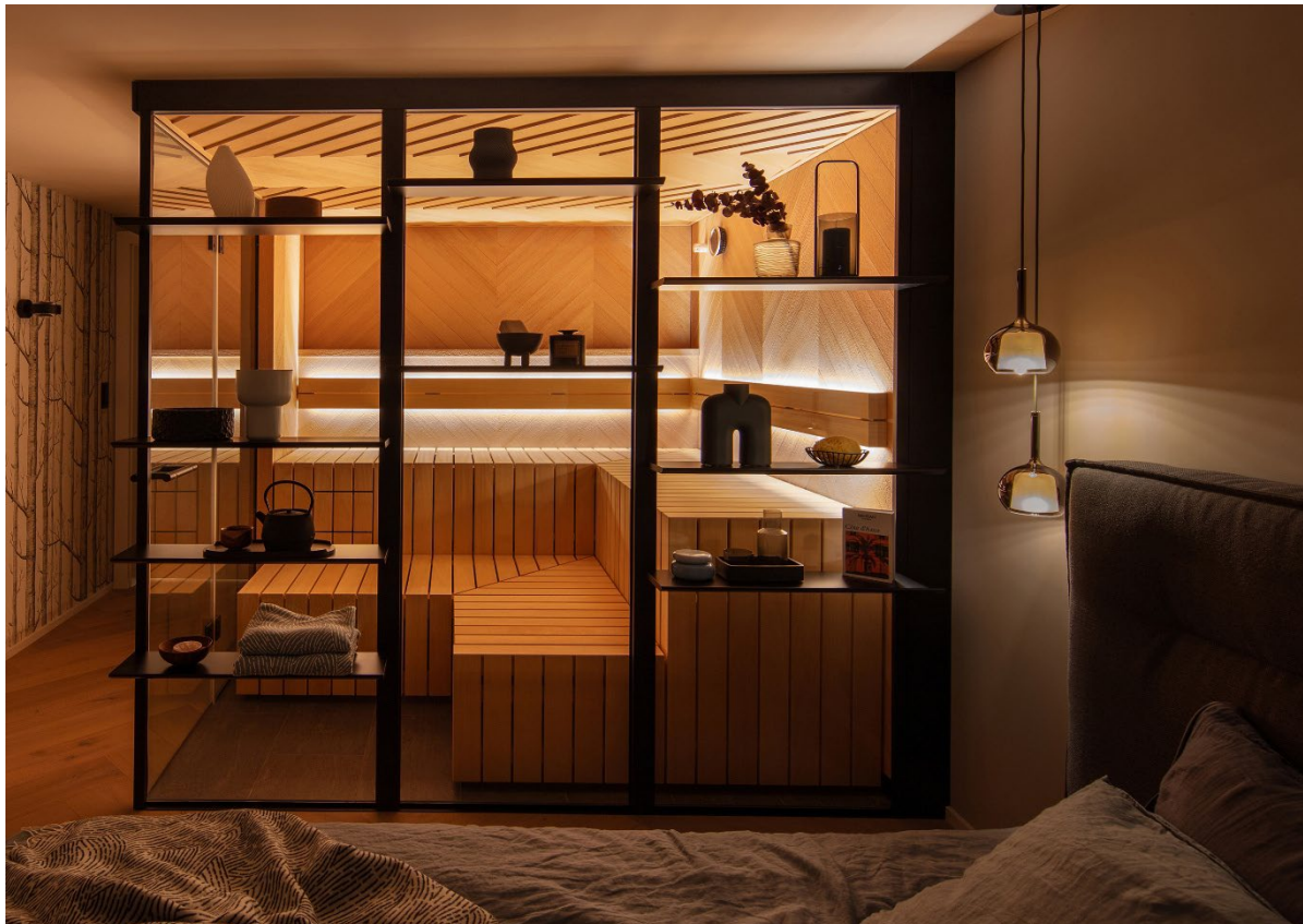
Das wohlliche Design der Sauna GESA schafft eine stimmige Verbindung zum Wohnraum.

Der Wunsch nach tiefgreifender Entspannung für den Körper und mentalem Wohlbefinden prägt die aktuellen Wellness-Trends. Denn ganzheitliche Gesundheit, Nachhaltigkeit und ein bewusstes Leben sind wichtiger denn je. Kleine Auszeiten statt Party, Stille statt ständiger Erreichbarkeit und Naturverbundenheit statt Reizüberflutung – Quality-Time und nachhaltige Regeneration rücken immer mehr in den Vordergrund und werden zum essenziellen Bestandteil unseres Lebens. Wellnesslösungen werden mehr und mehr auch im privaten Bereich zugänglich und inspirieren Menschen zu einem achtsamen Lebensstil und einer aktiven Gesundheitsvorsorge. Kompakte, hochästhetische Saunen und Dampfbäder mit modernen Technologien unterstützen diesen Trend. KLAFS – Pionier im Bereich Sauna, Spa und Wellness – zeigt, wohin die Reise geht und gibt Einblicke in die wichtigsten Wellnesstrends, die die Zukunft prägen werden.